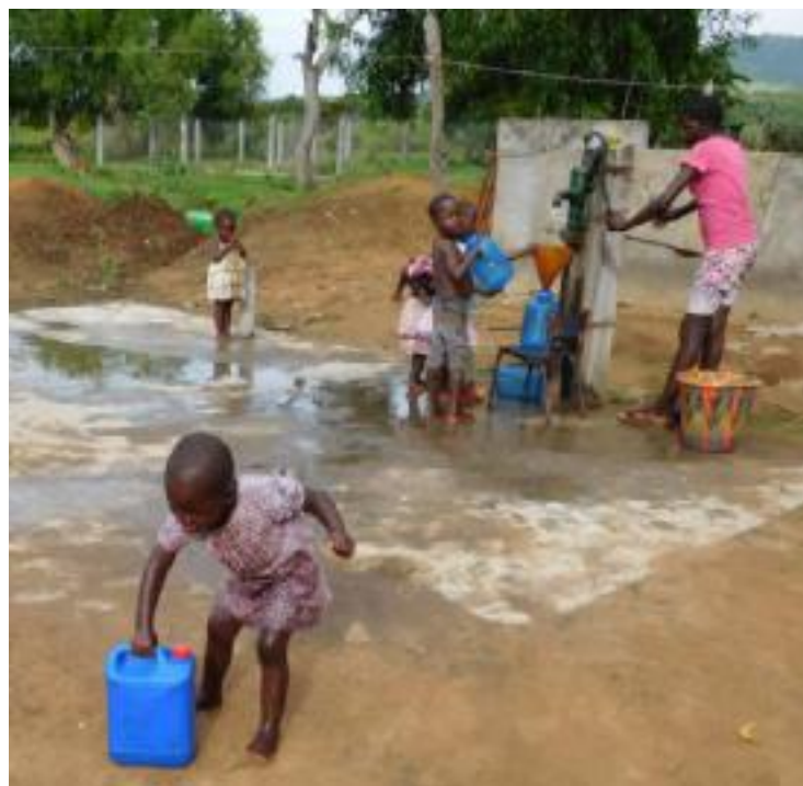
Een van de twee waterkranen in Budjala (3.200 km 2 ), Congo

Binnenkort verkopen ook wij in ons WZC flesjes water voor dit goede doel. En bij elke flesje water geven wij een gratis zakje paaseitjes mee!