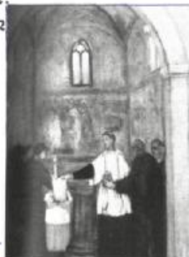
Albert Servaes 1920: Het Doopsel

in Mortsel een kruisweg waarvan de dramatische voorstelling met de skeletmagere figuren dermate aanstoot gaf dat het tentoonstellen van zijn werken in openbare bedehuizen door het Heilig Officie werd verboden.